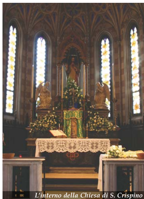
L'interno della Chiesa di S. Crispino