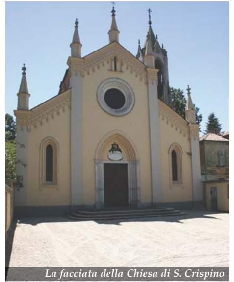
La facciata della Chiesa di S. Crispino

Nei settori laterali si notano due strette ed oblunghe finestre archiacute. La parte superiore della facciata esterna è ornata da una decorazione in cotto ad archetti pensili e caricata da cinque piccole guglie di semplice fattura geometrica e che si ripetono, sempre in numero di cinque, anche lungo i lati dell'edificio. Il settore murario laterale della chiesa è scandito da possenti