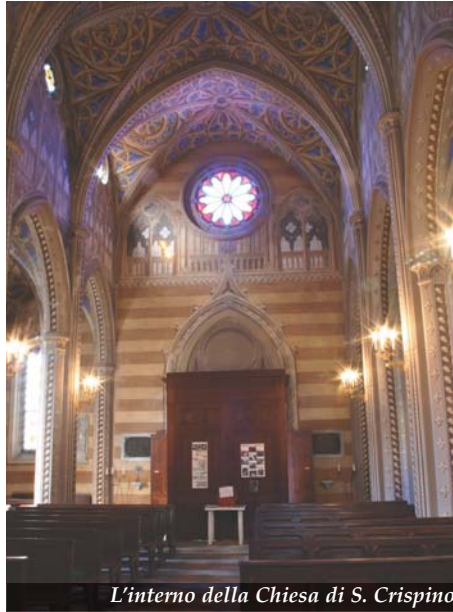
L'interno della Chiesa di S. Crispino

Ai lati del portale, internamente alla chiesa, alcune lapidi in marmo nero